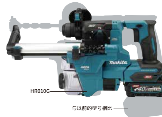
与以前的型号相比

DHR183 + DX16 电池: BL1860B 416 x 134 x 215 mm