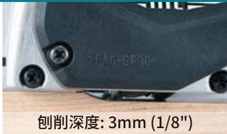
刨削深度: 3mm (1/8")