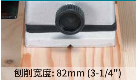
刨削宽度: 82mm (3-1/4")